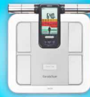
Cân đo lượng mỡ cơ thể