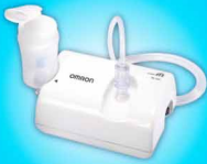
Máy xông mũi họng