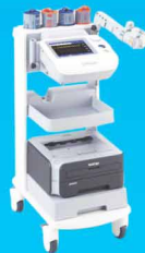
Máy Scan mạch không xâm phạm VP-1000 plus