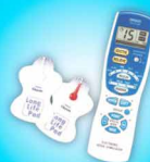
Máy massage xung điện