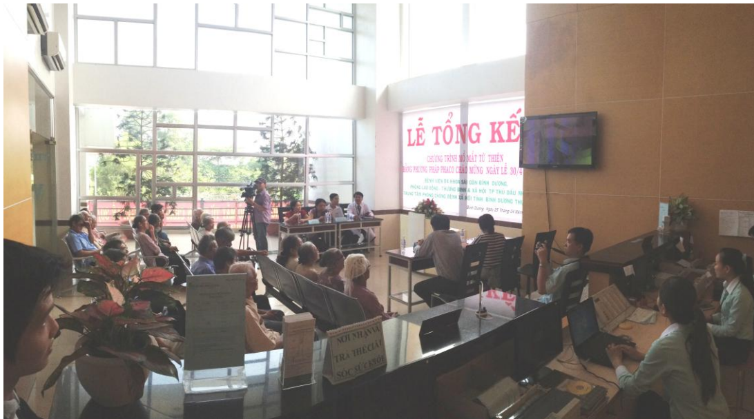
BVĐK SÀI GÒN BÌNH DƯƠNG