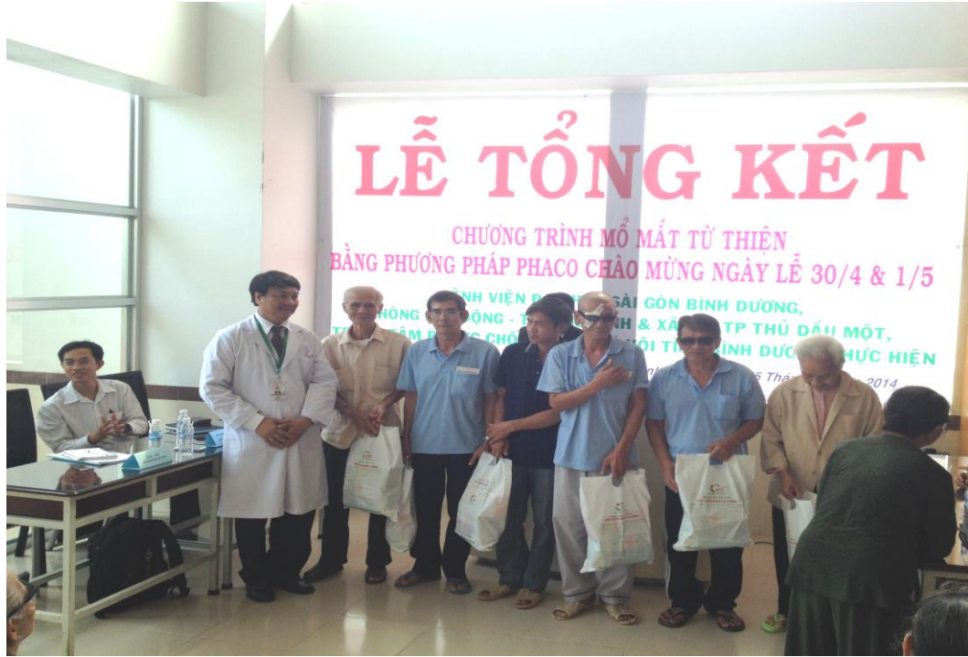
BUỔI TỔNG KẾT CHƯƠNG TRÌNH “MỞ MẮT TỪ THIÊN BẰNG PHƯƠNG PHÁP PHACO” DO BỆNH VIỆN ĐA KHOA SÀI GÒN BÌNH DƯƠNG PHỐI HỢP CÙNG PHÒNG LĐ TB & XH TP THỦ DẦU MỘT – TRUNG TÂM PHÒNG CHỐNG BỆNH XÃ HỘI TỈNH BÌNH DƯƠNG THỰC HIỆN