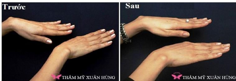
Bơm mỡ trẻ hóa bàn tay

Có hai hình thức ghép mỡ tự thân: chuyển khối mỡ và bơm mỡ. Hình thức chuyển vật hay khối mỡ tại chỗ được thực hiện khi vùng cho mỡ và vùng tổn khuyết kề cận nhau. Nếu vật mỡ có kích thước lớn thì cần phải có cuống mạch nuôi rõ rệt thì mới bảo đảm được khả năng sống tốt. Việc bơm mỡ là một kỹ thuật dùng bơm tiêm và canula để đưa mô mỡ đã được xử lý vào vùng nhận ghép. Theo đó, vùng cho mỡ là bất cứ nơi nào trên cơ thể, miễn là sau khi lấy không bị hõm khuyết ảnh hưởng đến vấn đề thẩm mỹ và thường được xác định ở bụng, hông, đùi, nếp mông,... Mỡ phải được lấy đúng kỹ thuật và phải được xử lý đúng cách thì mới đảm bảo khả năng tồn tại lâu dài.