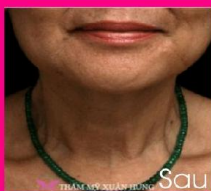
Căng da mặt cổ