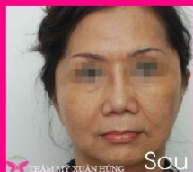
Căng da mặt cổ