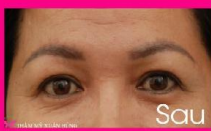
Nâng cung mày