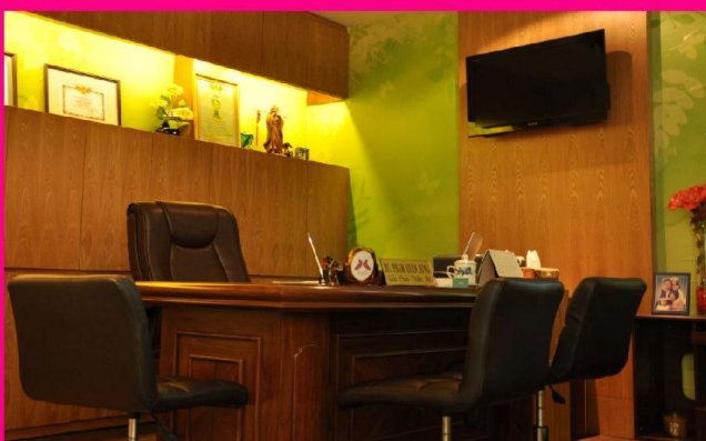
Phòng tư vấn