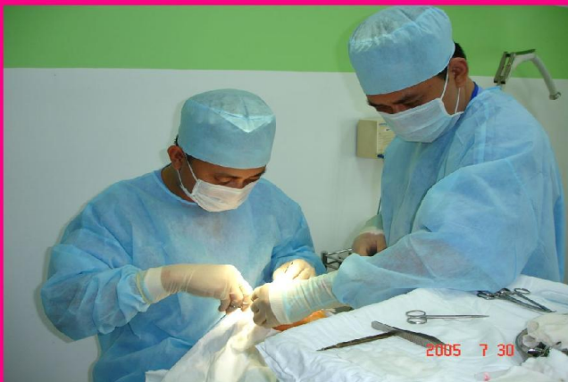
Bác sĩ đang thao tác phẫu thuật thẩm mỹ