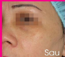
Điều trị nám