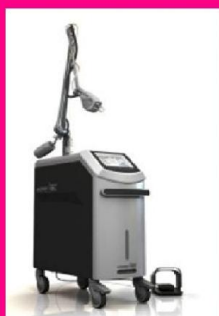
Máy laser Co2