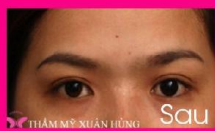
Tạo hình mí đôi