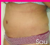
Hút mỡ bụng