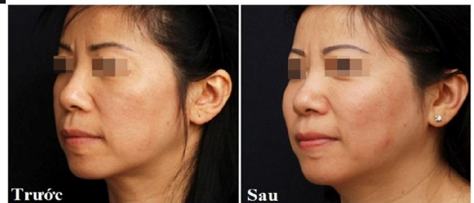
Bơm mỡ trẻ hóa khuôn mặt