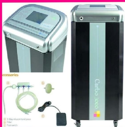
Máy Carboxy Therapy