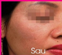
Điều trị nám Nevus Ota