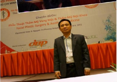
Hội nghị thẩm mỹ Tp HCM