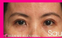
Tạo hình mí đôi