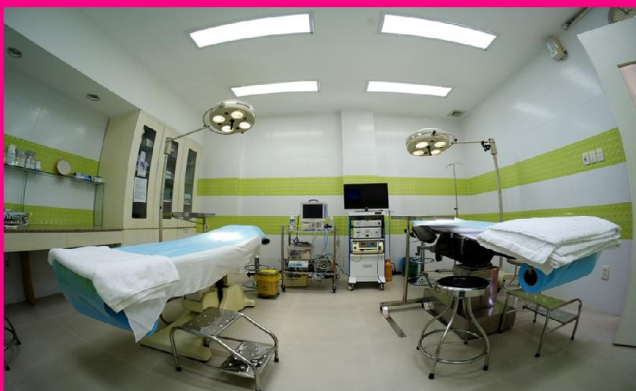
Phòng phẫu thuật