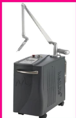
Máy laser Q-Switch